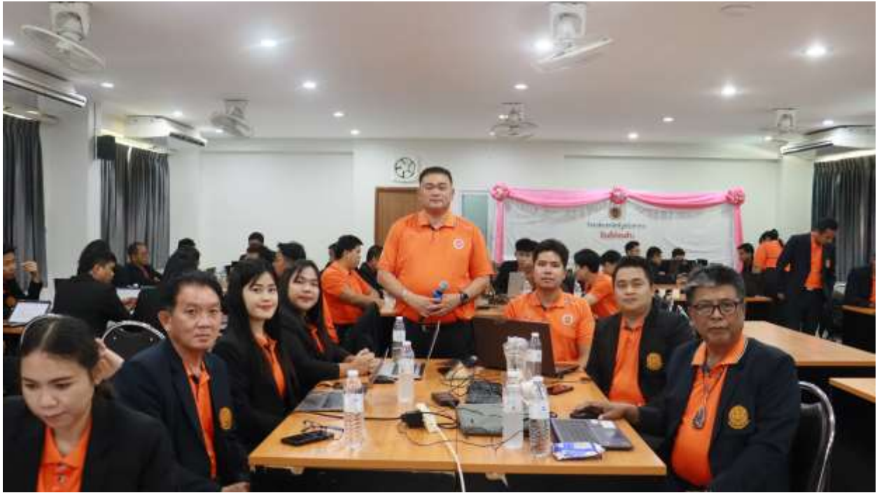
รูปภาพ การอบรมแผนปฏิบัติการ ประจำปีงบประมาณ พ.ศ. ๒๕๖๙